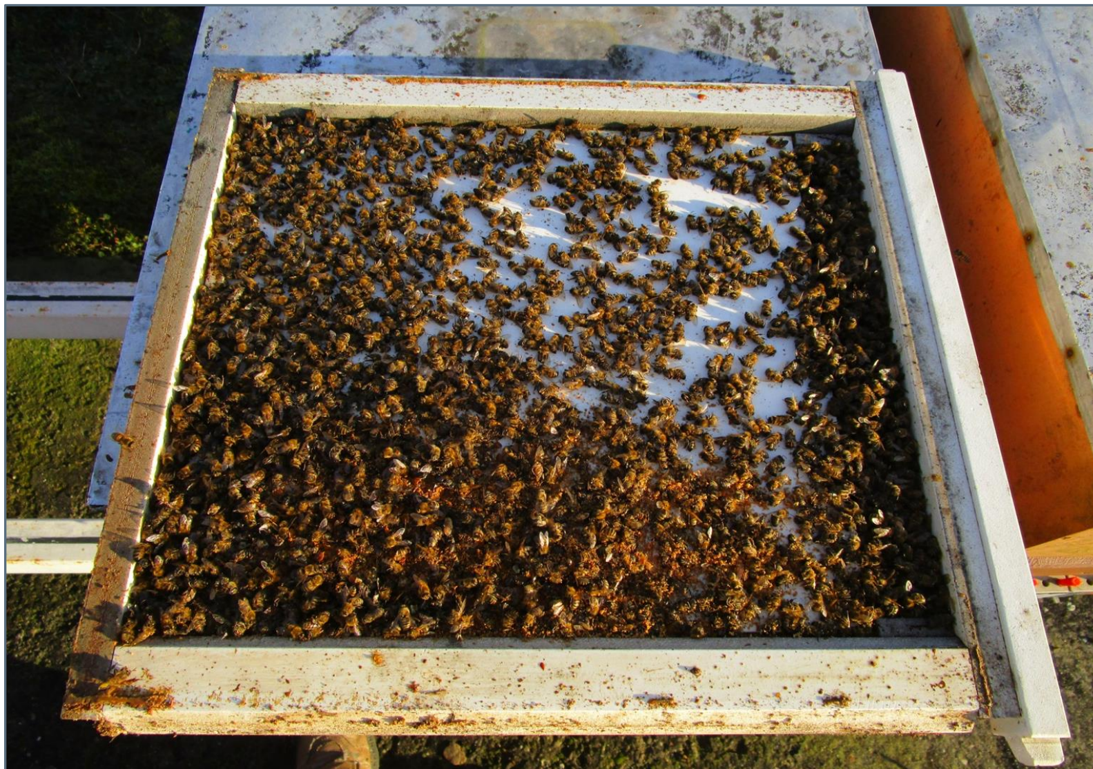
Déchets sur planchers le 15 février 2019