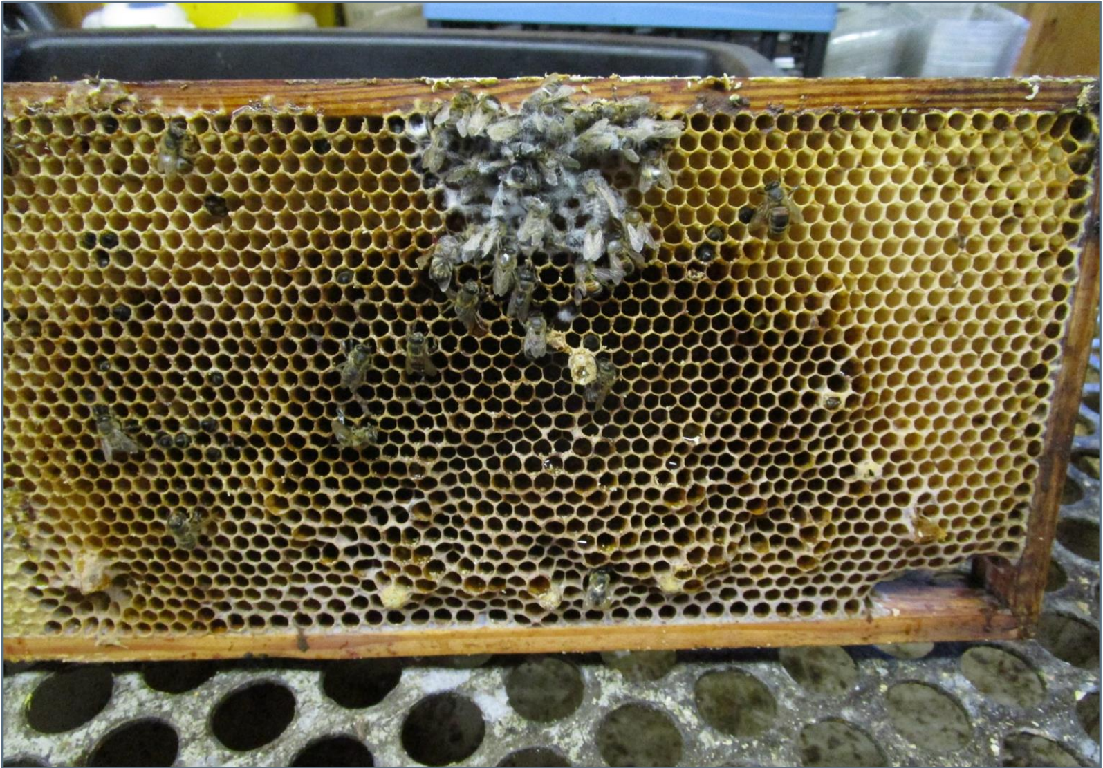
Ce qu'il reste dans une ruche morte