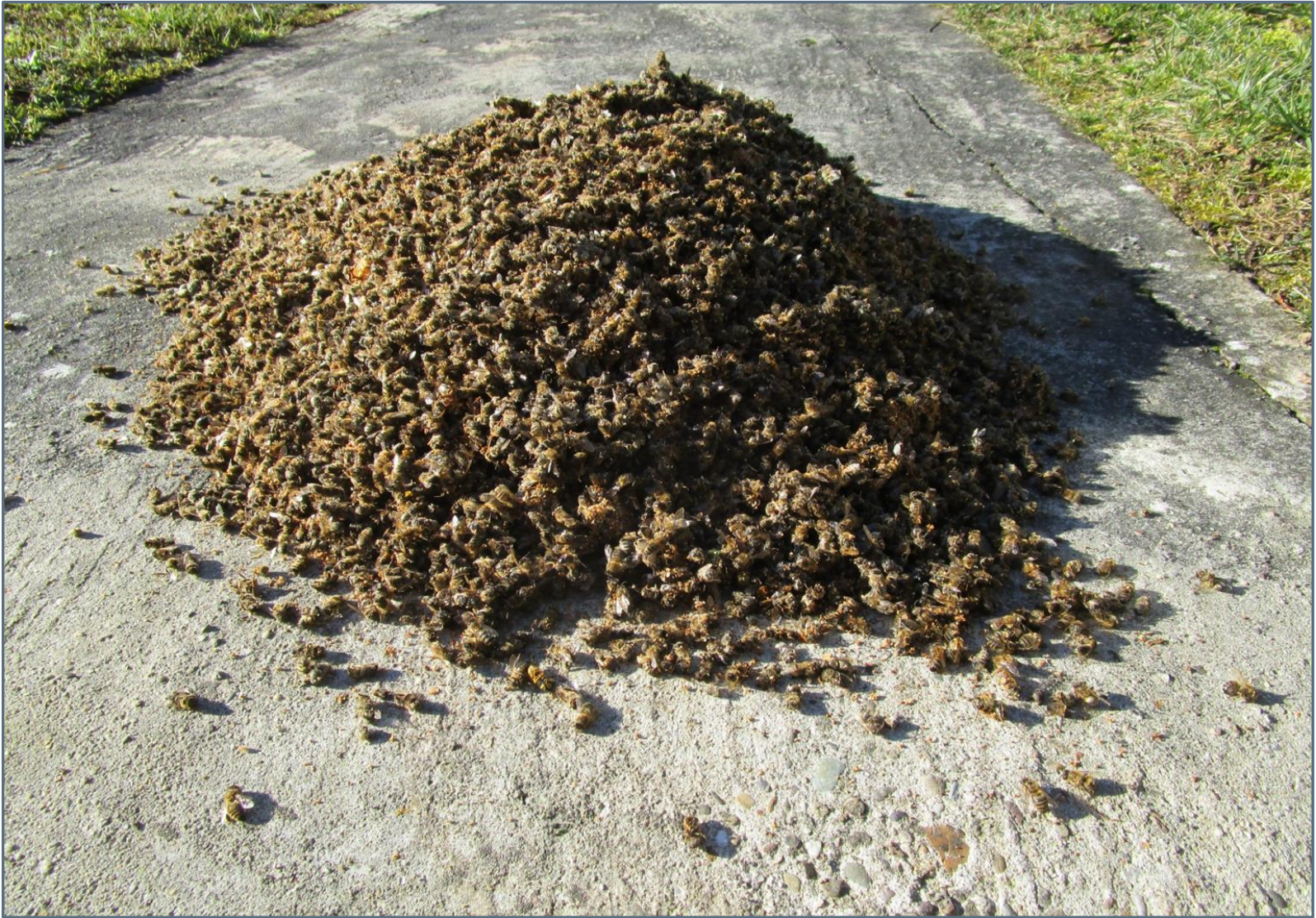
Déchets retirés de 40 ruches le 15 février 2019